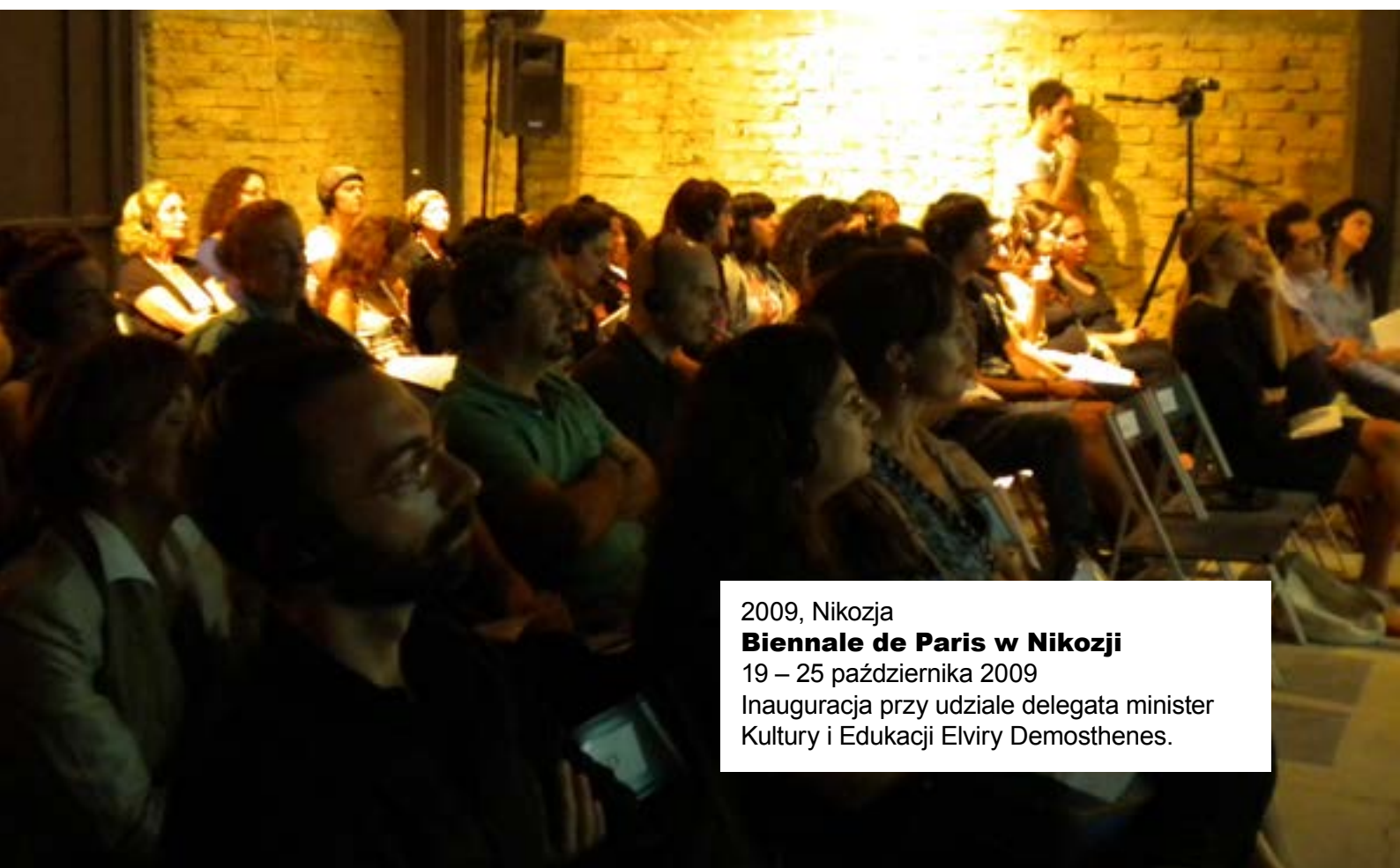
2009, Nikozja Biennale de Paris w Nikozji 19 – 25 października 2009 Inauguracja przy udziale delegata minister Kultury i Edukacji Elviry Demosthenes.