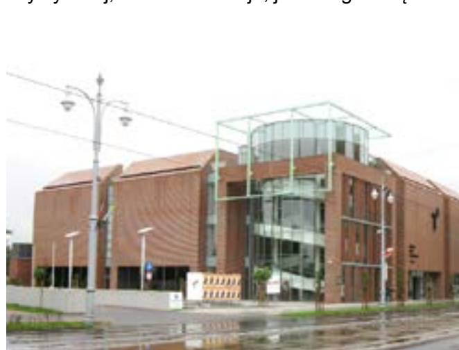
Centrum Sztuki Współczesnej Znaki Czasu

Otwarte w czerwcu 2008 roku Centrum Sztuki Współczesnej Znaki Czasu ugruntowało swoją pozycję jako jedno z najbardziej dynamicznych i innowacyjnych miejsc sztuki współczesnej w Polsce. Zlokalizowane w nowoczesnym budynku w samym sercu miasta, Centrum ucieleśnia silne pragnienie stworzenia żywej, dostępnej i zorientowanej na przyszłość przestrzeni twórczości artystycznej. Koncentrując się na praktykach współczesnych, intermedialnych i interdyscyplinarnych, oferuje eklektyczny i wymagający program, który skupia się zarówno na artystach polskich, jak i zagranicznych. Będąc miejscem dialogu i konfrontacji idei, Centrum zachęca do krzyżowania się sztuk wizualnych, nowych technologii, performansu, projektowania i badań teoretycznych. Jej celem jest promowanie krytycznej refleksji wokół najważniejszych problemów naszych czasów. Oprócz wystaw czasowych Centrum organizuje i współorganizuje konferencje, seminaria, rezydencje artystyczne, programy edukacyjne dla wszystkich odbiorców, prowadzi działalność edytorską, a przede wszystkim tworzy kolekcję prac reprezentatywnych dla sztuki współczesnej. Promując wymianę międzykulturową i tworząc klimat sprzyjający kreatywnemu relaksowi, ugruntowało swoją pozycję w odniesieniu do współczesnej sceny artystycznej, zarówno w kraju, jak i za granicą.