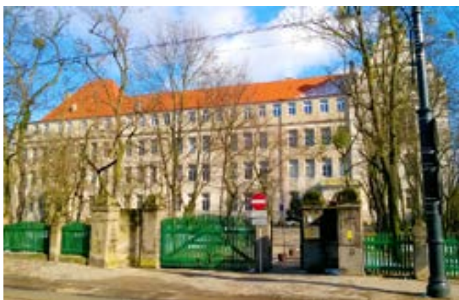
Wydział Sztuk Pięknych Uniwersytetu Mikołaja Kopernika w Toruniu

Wydział Sztuk Pięknych Uniwersytetu Mikołaja Kopernika , założony po zakończeniu II wojny światowej w 1945 r., powstał dzięki profesorom z uniwersytetów wileńskiego i lwowskiego, na terenach niedawno włączonych do Związku Radzieckiego (ob. odpowiednio na Litwie i Ukrainie). Wydział oferuje kompleksowe wykształcenie w trzech obszarach: sztuki – w zakresie malarstwa, grafiki, projektowania graficznego (w tym mediów cyfrowych), pedagogiki artystycznej i architektury wnętrz; nauki o sztuce – w zakresie historii sztuki, studiów nad dziedzictwem kulturowym i krytyki artystycznej; konserwacji i restauracji dzieł sztuki – w zakresie konserwacji malarstwa, rzeźby, zabytków kamiennych, papieru i skóry. Obecnie dziekanem jest prof. Filip Pręgowski.